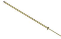
Lance télescopique en aluminium 0.5 - 1 m No. d'art. 10985204