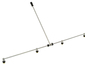
Rampe de pulvérisation en aluminium 12 bar max., vissable No. d'art. 11889501-SB