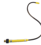
Mini-Flex No. d'art. 11947101