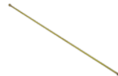
Lance en laiton 1 m, droite, G1/4"e-G1/4"i No. d'art. 10960601