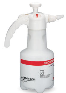
Food-Matic 1.25 P avec buse réglable No.d'art. 11990801

Pulvérisateur professionnel à pression approuvé pour utilisations alimentaires